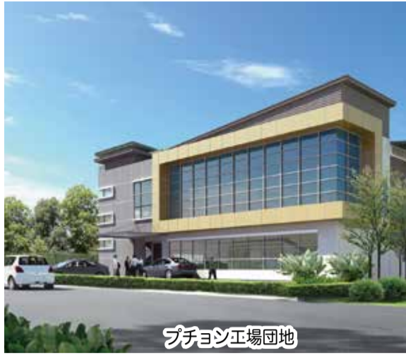
プチョン工場団地