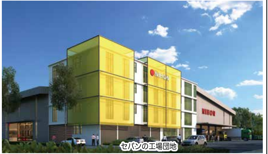
セパンの工場団地