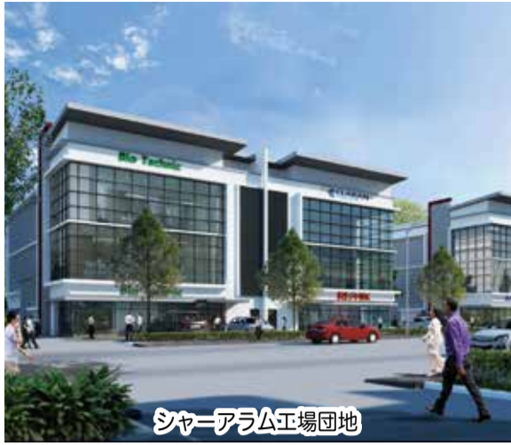
シャーアラム工場団地